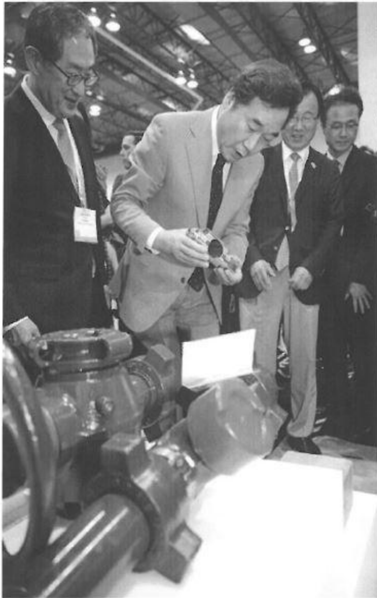
이낙연 국무총리가 8일(현지시간) 미국 휴스턴 NRG공원에서 열리고 있는 해양 박람회(OTC) 한국관 부스를 둘러보고 있다.