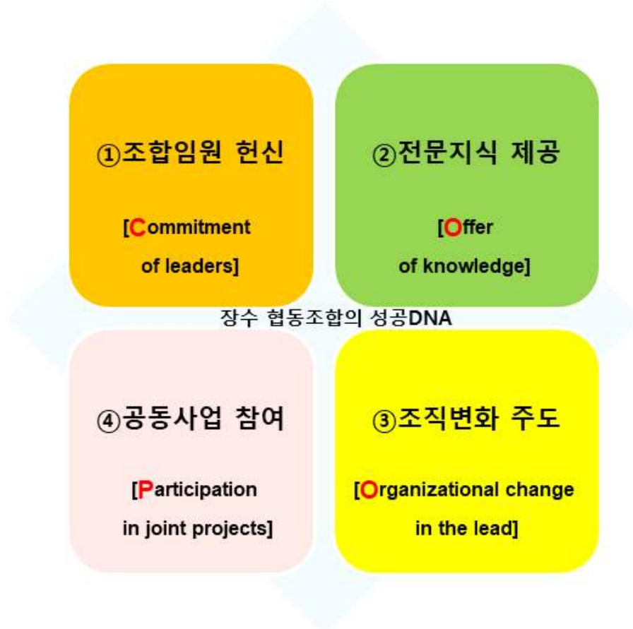
<그림4-1-1> 장수 중소기업협동조합 성공DNA

1. 성공DNA : COOPERATIVE (협동조합) → C.O.O.P.