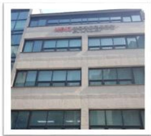
<그림 3-2-1> 한국장류협동조합