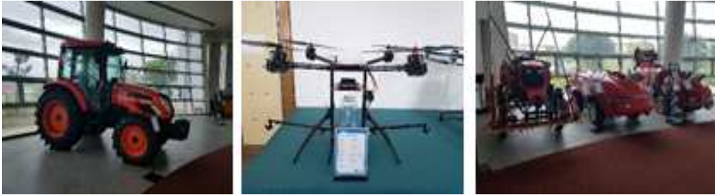
<그림3-2-5> 한국농기계공업협동조합 상설 전시·홍보관