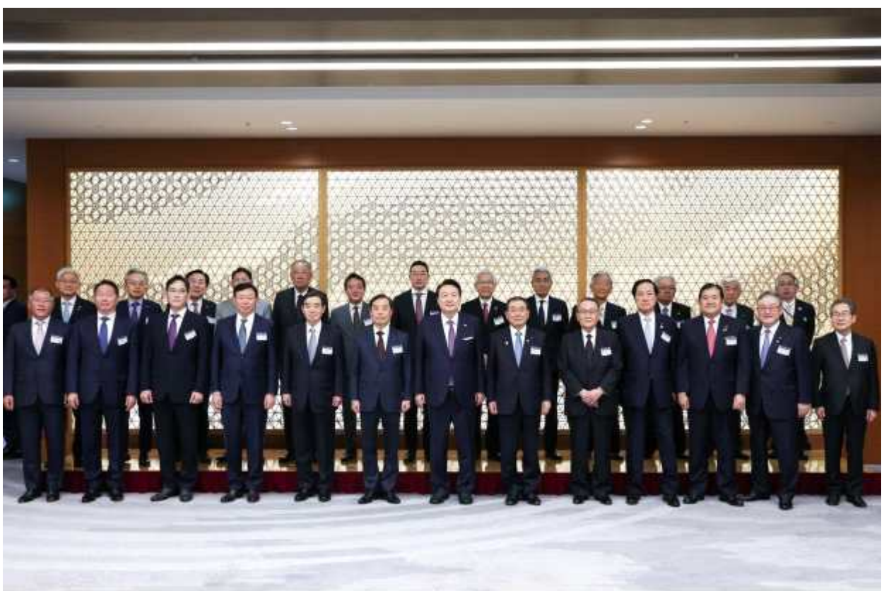
한·일 비즈니스 라운드테이블