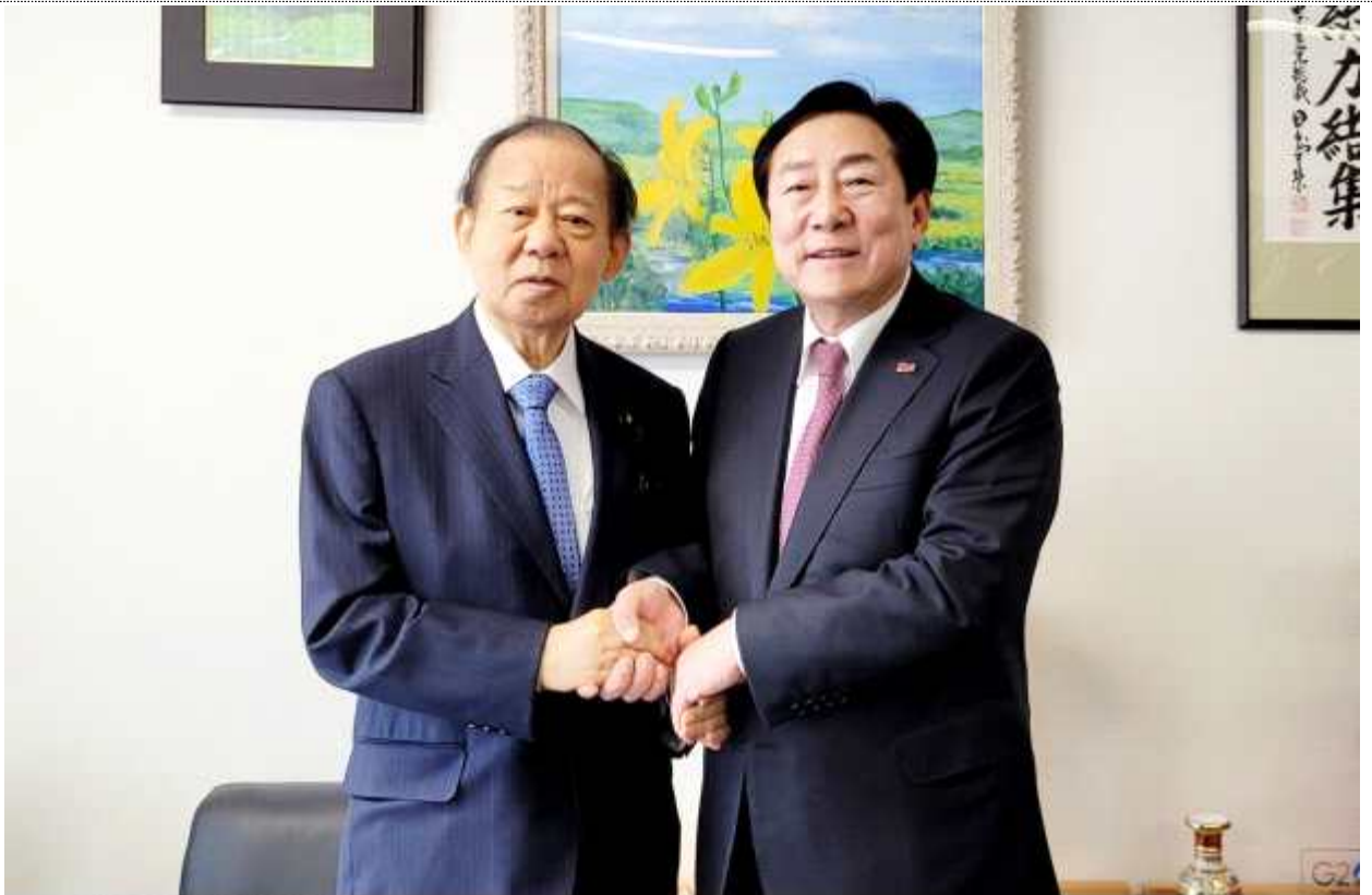
日 자유민주당 당사 방문

○ 주요내용 : 日 정부·국회 차원의 양국 중소기업 업종별 교류 지원 요청