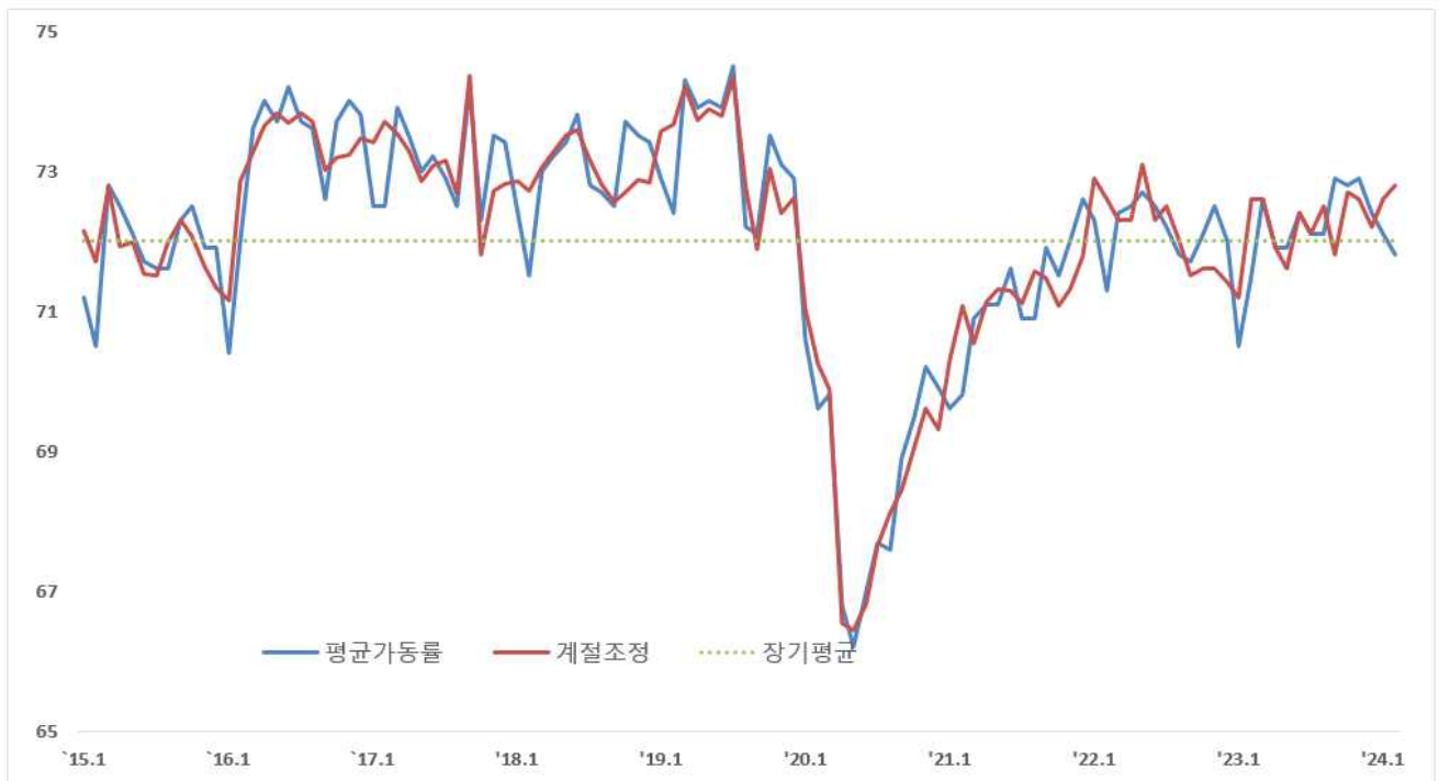
〈 중소기업 평균가동률 추이 〉