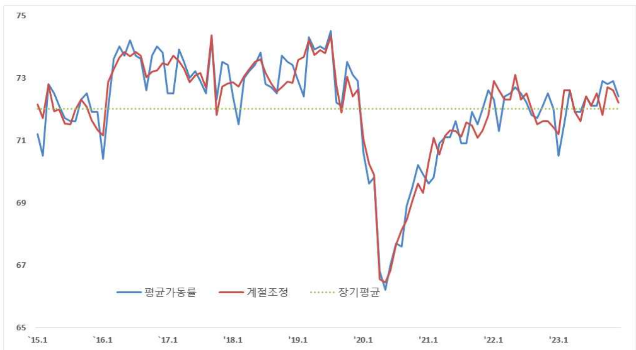
< 중소기업 평균가동률 추이 >