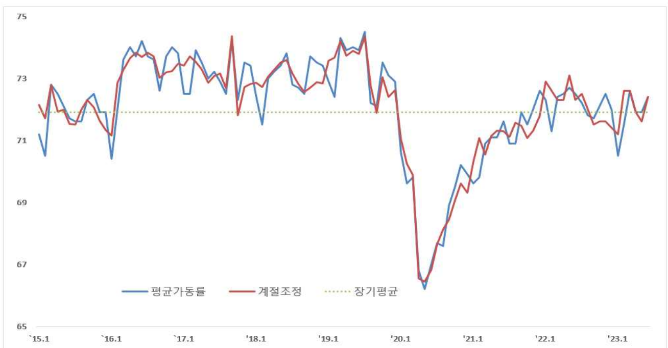
〈 중소기업 평균가동률 추이 〉