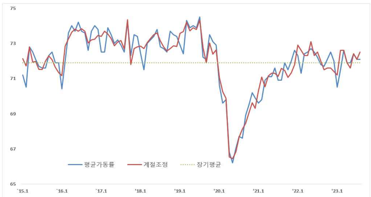
〈 중소기업 평균가동률 추이 〉