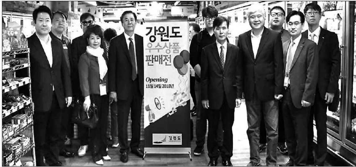
◇도 LA시장개척단은 지난주 미국에서 특판전과 수출상담회 등을 통해 높은 현지의 관심을 모았다.