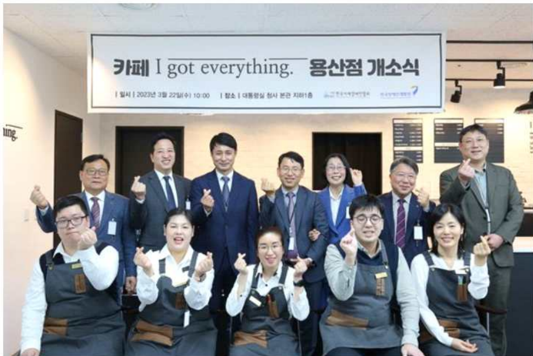
중증장애인 채용 카페 아이갯에브리씽 용산점이 지난 22일 대통령실 지하에 문을 열었다. 사진은 당일 10시에 열린 개소식에서 함께한 카페 직원들(앞줄)과 내빈들

한국장애인개발원(이하 개발원)은 "중증장애인 채용 카페 '아이갯에브리씽(I got everything)' 88호점이 지난 22일 오전 서울 용산구에 위치한 대통령실 청사에서 영업을 시작했다"고 24일 밝혔다. 아이갯에브리씽은 개발원이 중증장애인에게 안정적인 일자리를 제공하기 위해 추진하는 카페 사업이다.