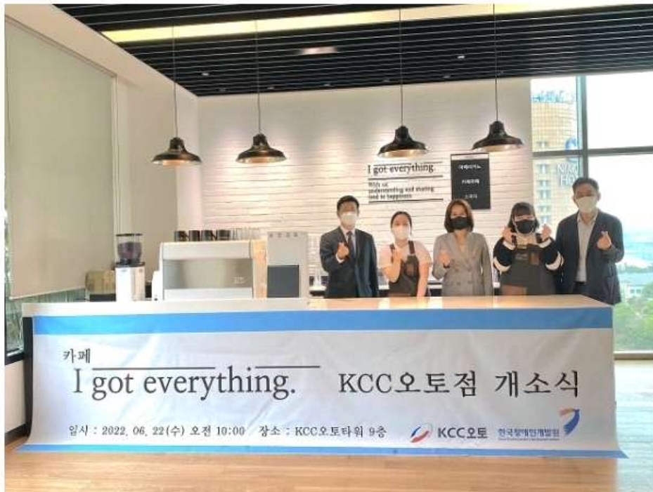
[첨부사진1] ▲ KCC오토가 중증장애인 채용 카페 '아이갯에브리씽'을 오픈했다.

KCC오토는 서울 강서구 염창동에 위치한 KCC오토타워(KCC오토 강서목동 전시장)에 중증장애인 채용 카페 '아이 갯 에브리씽(I got everything)' 개소식 행사를 진행했다고 15일 밝혔다.