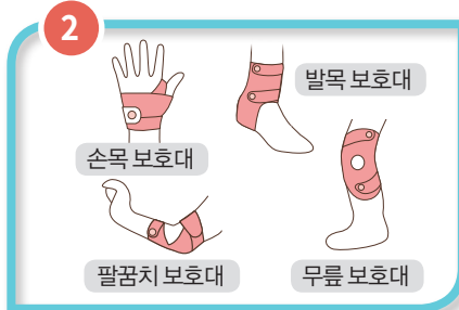
보호대 제공 작업자에게 근골격계 보호대를 무상제공 합니다.