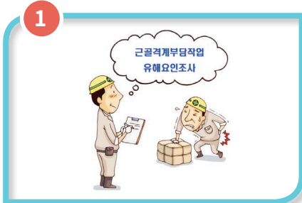
유해요인조사 실시 산업보건 전문가가 유해요인 조사를 실시하고 개선대책을 제시합니다.

▶ 산업보건분야 전문가가 방문하여 근골격계질환 예방을 위한 종합서비스를 제공합니다.