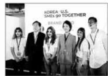
21일(현지시간) 미국 뉴욕 Pier17에서 열린 ‘K-뷰티 수출상담회’에서 김기문(왼쪽 둘째) 중기중앙회장과 이영(왼쪽 넷째) 중기부 장관이 기념 촬영을 하고 있다.

한편, 중기중앙회는 중기부가 주최한 ‘KOREA-US SMEs go TOGETHER’ 행사의 하나로 롯데홈쇼핑과 함께 ‘K-브랜드 엑스포’를 개최하고 뷰티업계 수출중소기업 20개사의 미국시장 진출 확대를 위해 1:1 B2B 수출상담을 지원했다. 김기문 중기중앙회장은 “지난 몇