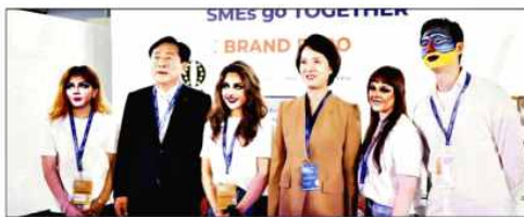
21일(현지시간) 미국 뉴욕 Pier17에서 열린 ‘K-뷰티 수출상담회’에서 김기문 중기중앙회장(왼쪽 2번째), 이영 중기부 장관(왼쪽 4번째)이 관계자들과 기념촬영을 하고 있다.

행사 이튿날 저녁에 약 2시간 동안 진행된 K-POP 스타들의 공연에는 뉴욕