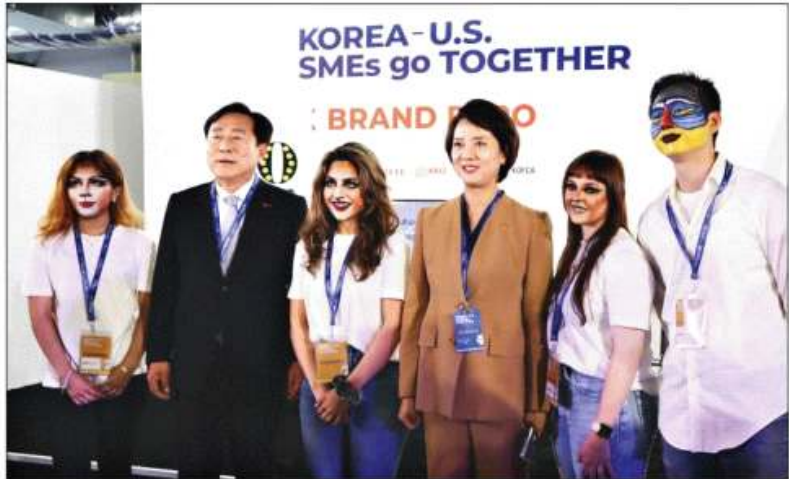
김기문 중기중앙회장(왼쪽 두번째)과 이영 중기부 장관(왼쪽 네번째)이 21일(현지시간) 미국 뉴욕 피어(Pier)17에서 열린 ‘케이(K) 뷰티 메이크업쇼’에 참석해 기념촬영을 하고 있다.

이날 수출상담회 현장을 찾은 김기문 중기중앙회장은 참여기업의 제품들을 직접 소개하며 미국 현지 바이어들의 적