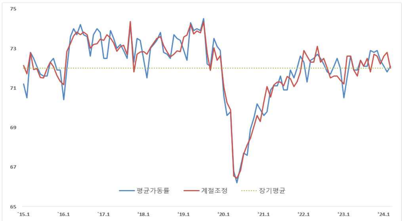
〈 중소기업 평균가동률 추이 〉